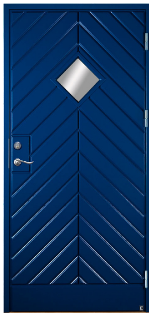
BAVARIA 980 G02 1629 BLÅ