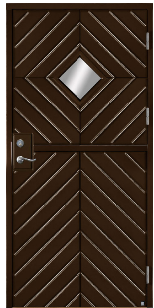
BAVARIA 990 G02 RAL 8028 TERRABRUN