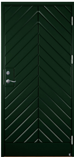
BAVARIA 980 1548 CYPRESSGRÖN