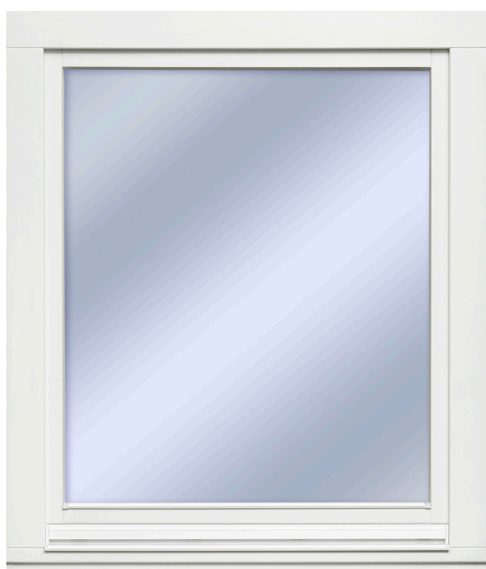
EC/90 EI30 TRÅ UTSIDA

EC/90 serien finns även i ljudklassat utförande, EC/90 SR46dB och som passivhuscertifierat fönster, EC/90 Plus+ med U-värde 0,78W/(m 2 K).