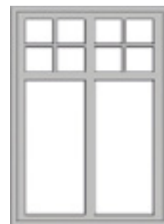
GDP 1:1 / SP1:1