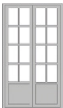
SP 3:1 Fyllning