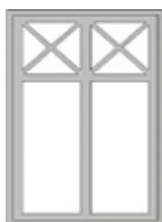
GDP 1:1 / Krysspröjs