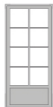
SP 3:1 Fyllning