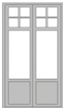
SP 1:1 / GDP1 :0 Fyllning