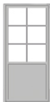
SP 2:1 Fyllning